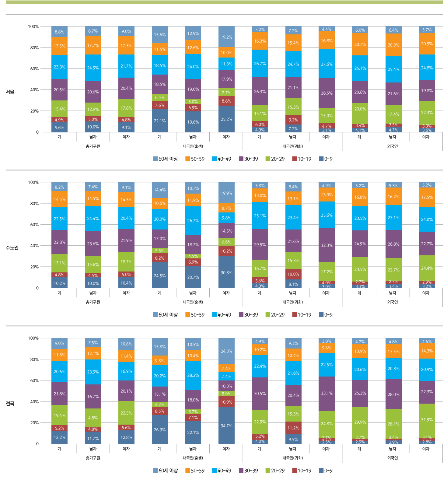
부록- 그림 3 서울, 수도권, 전국의 성별 연령별 가구원 비중